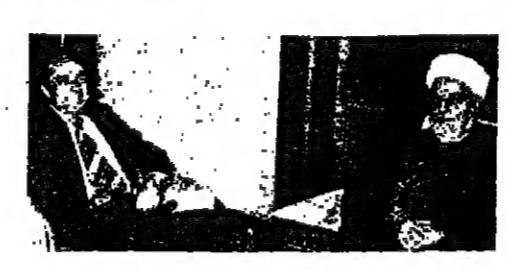
الاسعد وعفي بديك